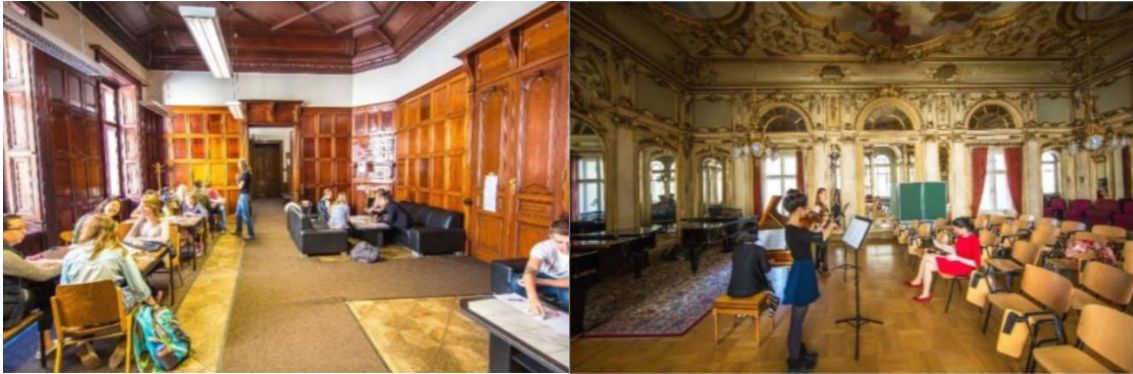
(IES Abroad 维也纳中心学生休息室)

IES Abroad 维也纳中心，位于美丽且历史悠久的 Palais Corbelli: Palais Corbelli 是一座位于维也纳市中心的 17 世纪的优雅宫殿，距离维也纳的许多博物馆、剧院和其他主要文化景点仅几分钟路程。