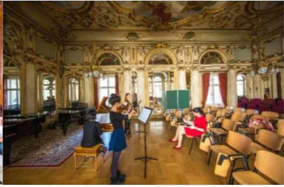
(IES Abroad 维也纳中心音乐大厅)