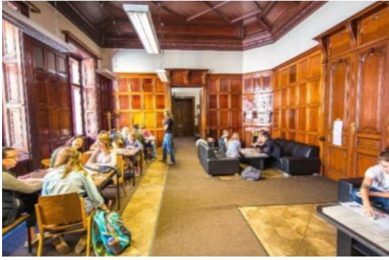
(IES Abroad 维也纳中心学生休息室)