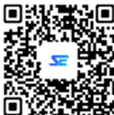
So Easy智能外语APP下载二维码

2023年10月15日0:00至16日23:59之间，参赛者通过关注“ So Easy智能外语 ”微信公众号或扫描下方二维码下载APP，登录APP：首页-发现-活动推荐 选择所需比赛渠道报名参赛，17日零点，比赛正式开始后将不能再报名比赛。