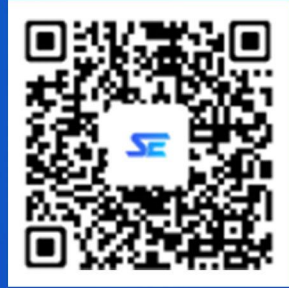
So Easy智能外语APP 下载二维码