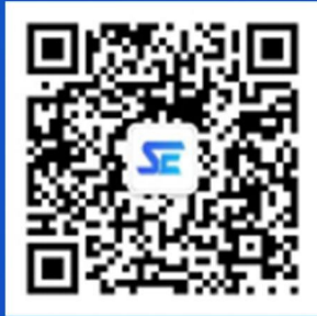
So Easy智能外语APP 微信公众号