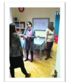
（ IES Abroad 巴黎中心 ）