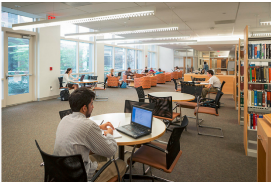
Kenan Science Library

参加项目的学生可以自由使用 UNC 的校园设施，如图书馆、健身房、计算机中心、学生活动中心等。