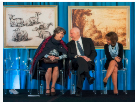
Ackland Art Museum