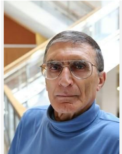
阿齐兹·桑贾尔 2015 诺贝尔化学奖