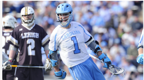
UNC beat Mountain Hawks 15-8