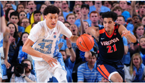
Carolina defeated Virginia in the ACC