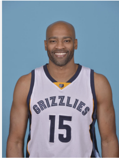
文斯·卡特 NBA 扣篮王